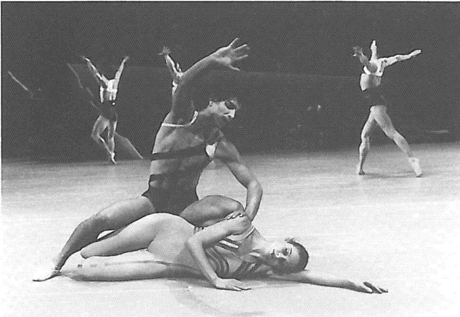
Aartsengelen slachten den hemel rood van Rudi van Dantzig