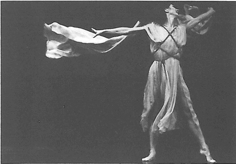
Vijf walsen van Brahms van Sir Frederic Ashton